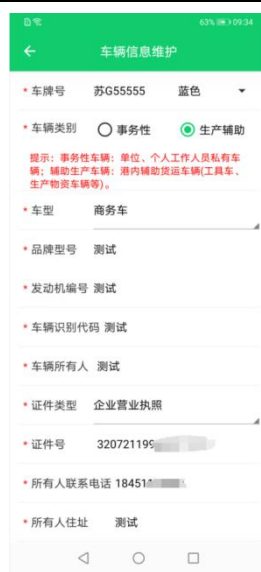
车辆信息浏览界面